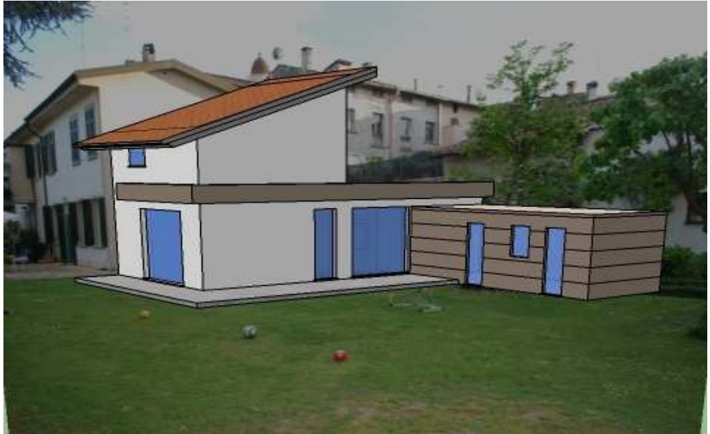
Vista fronte sud