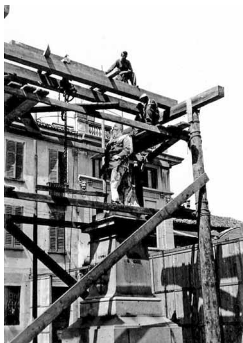
Due immagini della statua di Vittorio Emanuele II nei giorni successivi all'attentato del 1946, dal servizio fotografico realizzato da E. Malliani in occasione della demolizione del monumento.