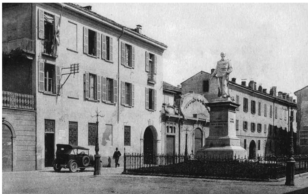
La statua del Re prima dell'attentato del 1946.