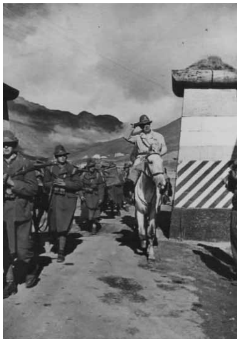
Passaggio del colle del Moncenisio a cavallo giugno 1940