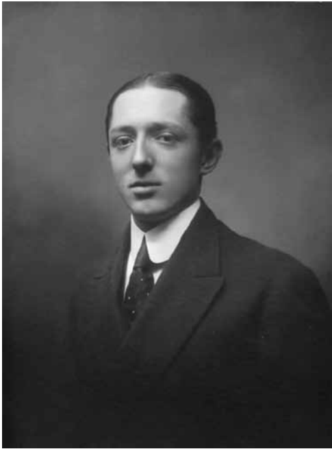
Foto di laurea 1920