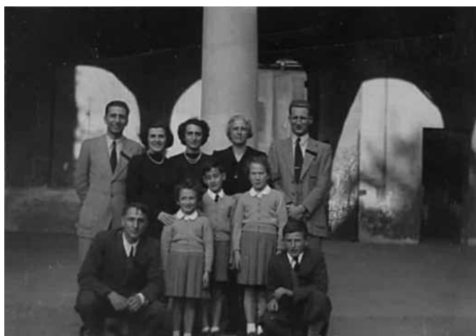
I figli nel 1950, appena dopo la scomparsa del papà.