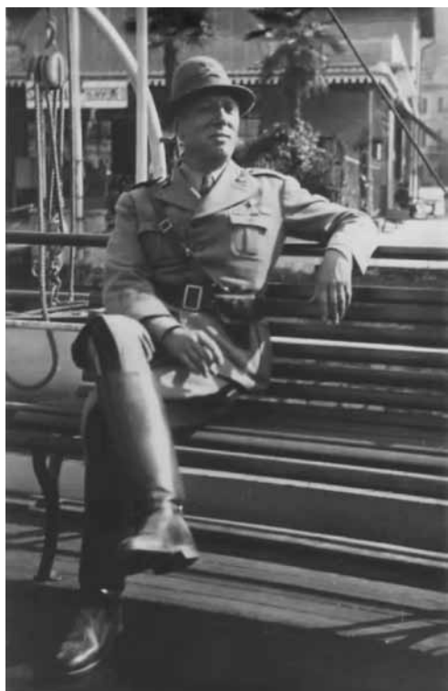
A Borgomanero nel periodo di comando reparti in addestramento 1942/43. Foto in divisa 1942 circa