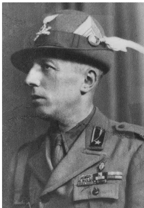
Foto durante il corso allievo ufficiale 1915