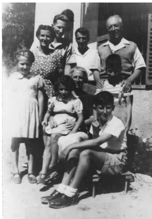
Foto con parte della famiglia Antey S.André (Val-tournanche) agosto 1949 (ultima foto del papà).