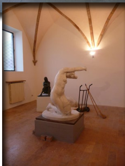
La sala C ridipinta con le statue di Girbafranti e Barbaro poi trasferite, rispettivamente, nella sala B e nella sala A