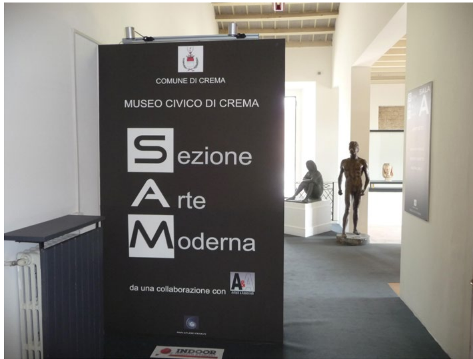
L'ingresso della nuova Sezione