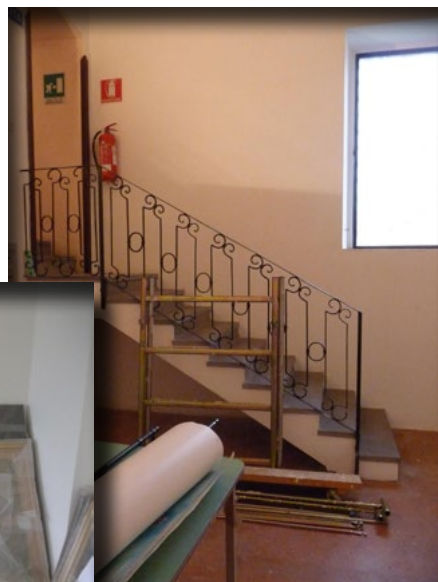
La sala B durante i lavori di riallestimento