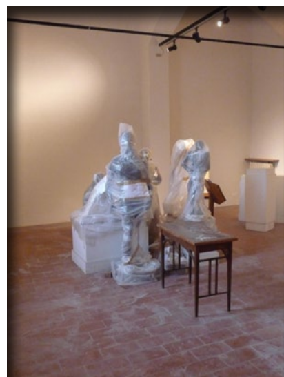
La sala D nel pieno dei lavori