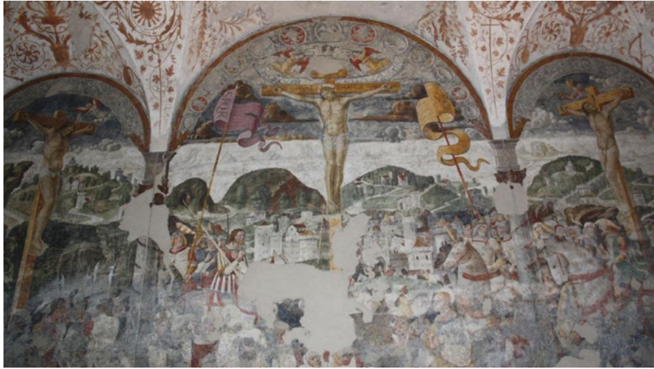
3. Gianpietro da Cemmo, Crocifissione , 1507, affresco. Crema, Centro Culturale S. Agostino, Sala Gianpietro da Cemmo