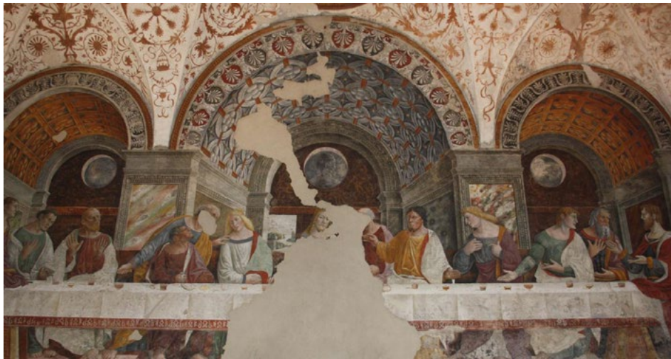
4. Gianpietro da Cemmo, L'Ultima Cena , 1507, affresco. Crema, Centro Culturale S. Agostino, Sala Gianpietro da Cemmo

intervenire, l'edificio venne ristrutturato dall'architetto Amos Edallo, 11 sotto la supervisione della contessa. Il prefabbricato venne così recuperato e inserito degnamente nel patrimonio artistico della città.