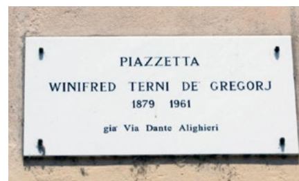
5. Targa che indica la piazzetta dedicata alla contessa