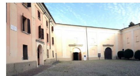
6. Veduta della Piazzetta Terni de' Gregory, ospitante il Centro Culturale S. Agostino

Palazzo Terni e il Centro Culturale, venne chiamata Piazzetta Winifred Terni de' Gregory, per dare testimonianza della sua vita a tutti coloro che passano per il centro di Crema.