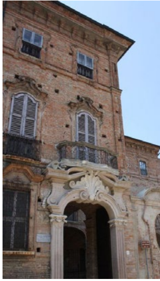
1. Palazzo Terni de' Gregory: esterno