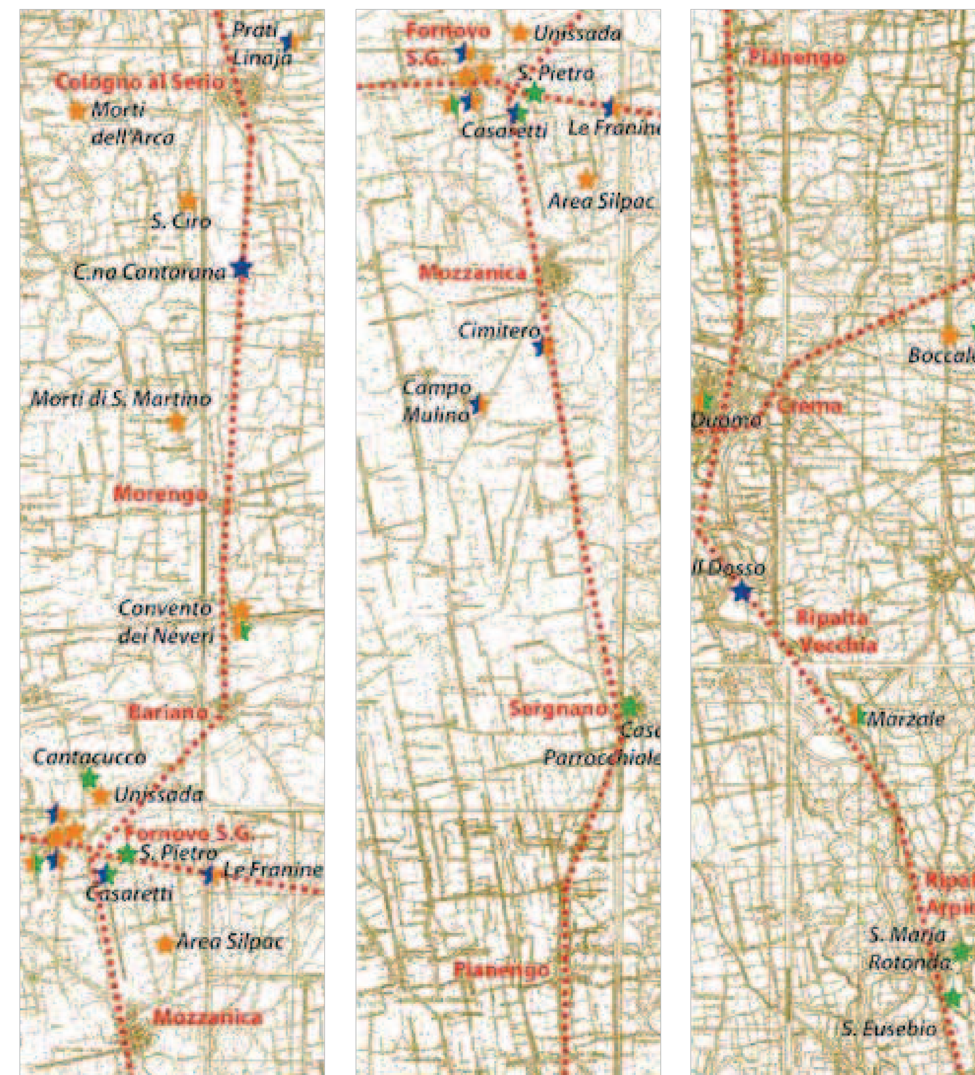
Ricostruzione del tracciato della via Bergomum-Cremona da Cologno al Serio a Ripalta Arpina e delle intersezioni con la strada da Mediolanum passante per Forum Novum e con la via Laus Pompeia-Brixia . In blu i siti di età protostorica e gallo-romana, in giallo quelli di età romana, in verde quelli altomedievali (base cartografica derivata da una riduzione delle tavolette IGM in scala 1:25.000, Anni Trenta del XX secolo).