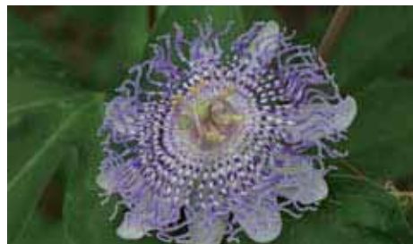
40. Passiflora 'Guglielmo Betto'

almeno io non ne ho avuto notizia. Accadde che le due piante fiorissero contemporaneamente e, conoscendo bene la facilità con cui la P. incarnata accetta polline di altre specie, sfruttai la coincidenza. Ottenni un frutto contenente semi ibridi.