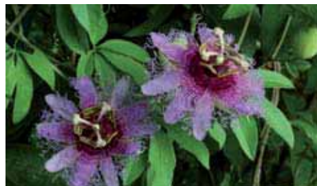
13. A DESTRA Passiflora coccinea