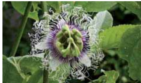
15. Passiflora edulis

Anche il frutto, dalla forma ovoidale e dalle striature longitudinali di colore verde scuro che diventano gialle od arancioni a maturazione, è molto decorativo. Ha un ottimo sapore ed è da considerare tra i migliori frutti prodotti dalle passiflore.