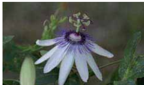
34. A DESTRA Passiflora 'Corry Rooymans'