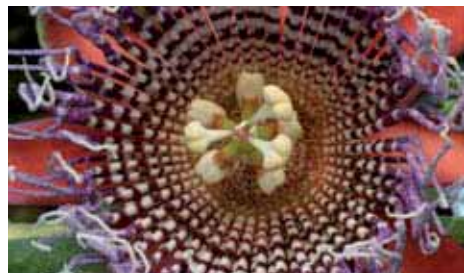
28. Passiflora x decaisneana