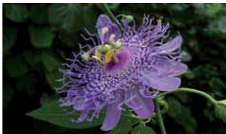
39. Passiflora 'Fata Confetto'

un'eruzione di lava e anche da questa impressionazione deriva la sua denominazione.