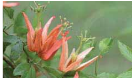
9. Passiflora aurantia

na 'São Sebastião', P. amethystina 'Macaé de Cima', ecc.