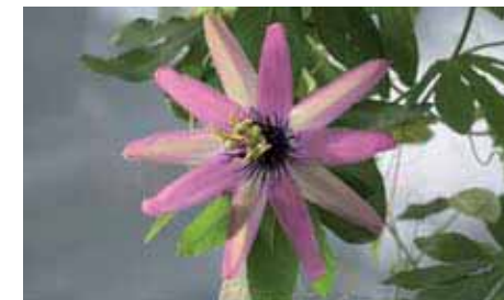
42. Passiflora 'La Venexiana'

Il fiore della P. 'La Lucchese' è di un raro color amaranto per la presenza della P. kermesina nella sua complessa composizione. Il violetto della madre, P. 'Fata Confetto' è quindi virato verso il rosso grazie al colore del padre. La corona dei filamenti non è molto fitta e lascia trasparire la corolla. Singolare è la presenza di bande alterne al centro del fiore e la sfumatura verso il bianco puro degli apici dei