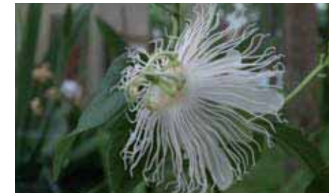
17. Passiflora incarnata forma alba

è bianca, diventa poi rosa carico con qualche piccola banda di colore contrastante e, per l'altra metà, fino all'apice, è di nuovo bianca. Nel suo insieme il fiore, che è anche profumato, ha l'aspetto vaporoso di un batuffolo di cotone. Ne esiste anche una varietà completamente albina, la spettacolare P. edulis 'Norfolk'.