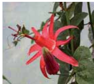
18. Passiflora murucuja