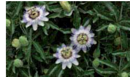
10. Passiflora caerulea

dall'Australia. Inoltre il colore aranciato (o rosso-arancio) dei suoi fiori, che tendono a rimanere semichiusi, è rarissimo nel genere Passiflora .