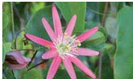
29. Passiflora 'Kew Gardens'

caratterizzata da perfette bande alternate di bianco e di porpora, autorizza a pensare che sia finto, ma non si deve dimenticare che la natura ha spesso risorse che noi neppure immaginiamo.