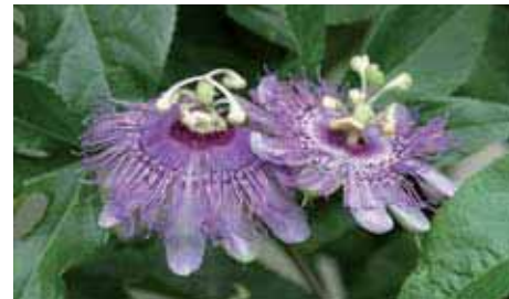
16. Passiflora incarnata

La P. cupraea in natura è diffusa in molte isole dei Caraibi, da Cuba alle Bahamas, ma è molto rara presso i collezionisti, poiché è coltivata solo da pochi anni.