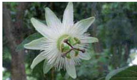
11. Passiflora careulea 'Constance Elliott'