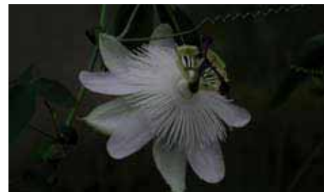
37. Passiflora 'Clara Luna'

di azzurro e di blu. I filamenti, meno arricciati e più robusti, tradiscono forse il 'sangue' paterno, che rimane comunque determinante per la creazione di questa rara colorazione blu chiaro.