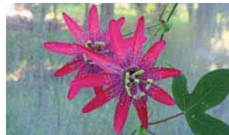
30. Passiflora 'Pura Vida'

proveniente da questa specie. Le notizie sulla sua origine, tuttavia, sono incomplete e non esaurienti.