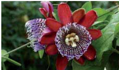
7. Passiflora alata