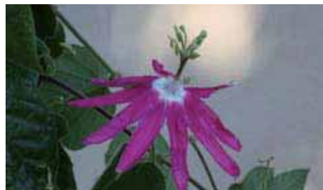
22. Passiflora sublanceolata

I fiori infatti sono simili a quelli della P. capsularis e della P. citrina . Il loro diametro è di circa 5 cm e sono composti da sepalii e da petali color avorio.