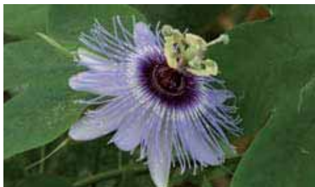
35. Passiflora 'Angelo Blu'