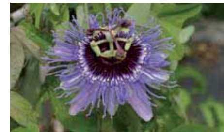
31. Passiflora 'Purple Haze'

La P. 'Kew Gardens' (chiamata precedentemente P. x kewensis ) è un rampicante robusto, in condizioni adatte cresce con rapidità e fiorisce in continuazione sulle estremità dei tralci. Gli apici dei tralci recano ad ogni nodo i boccioli che si sviluppano man mano che il tralcio si allunga. I fiori aperti sono seguiti da boccioli che si fanno sempre più piccoli in direzione della cima del fusto.