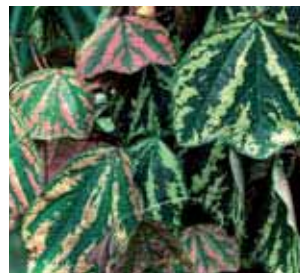
19. Passiflora organensis