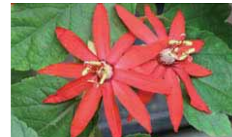
24. Passiflora vitifolia

dotata di un proprio autonomo movimento. I fiori misurano circa 3-4 cm di diametro. I sepalii, i petali, la doppia e rada corona dei filamenti hanno tonalità che vanno dal bianco al crema. Una leggera venatura rosa appare a volte sui filamenti più interni, che sono più fitti e più corti.