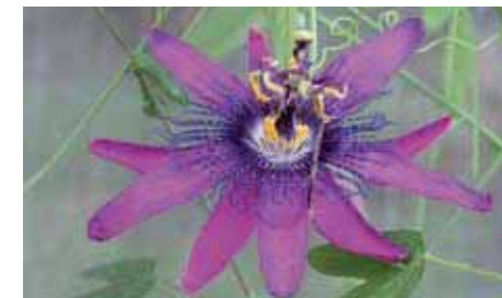
38. Passiflora 'Etna'

dimensioni, avendo un diametro di 10 cm. La corolla è arricchita da una corona candida costituita da fitti filamenti.