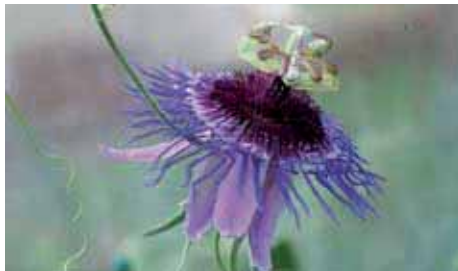
8. Passiflora amethystina

gli occhi e lascia un ricordo indimenticabile. Ai fiori seguono i frutti, gialli a maturazione, di forma ovoidale e commestibili.