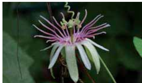
21. Passiflora rubra

sepalii sono uncinati, i petali sono stretti ed allungati.