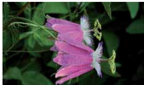
36. Passiflora 'Aurora'

che il fiore, in giornata, si sarebbe aperto.