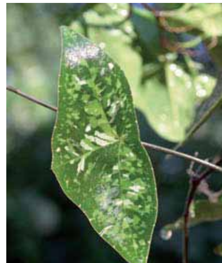
43. Passiflora 'Manta'