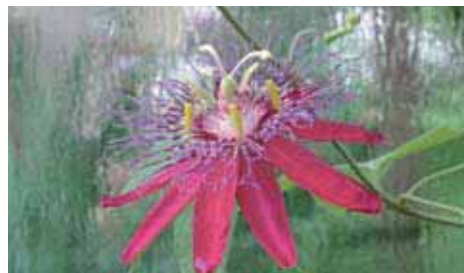
32. Passiflora 'Red Inca'