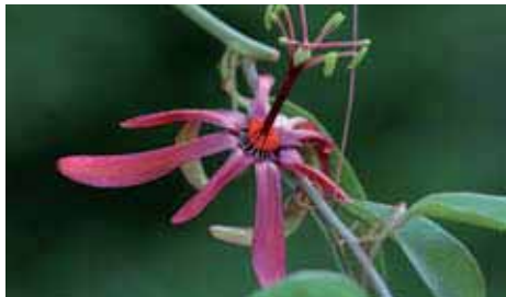
14. Passiflora cupraea