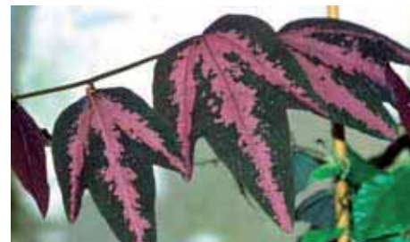
23. Passiflora trifasciata

sono rosa carico brillante. La corolla tende a retroflettersi.