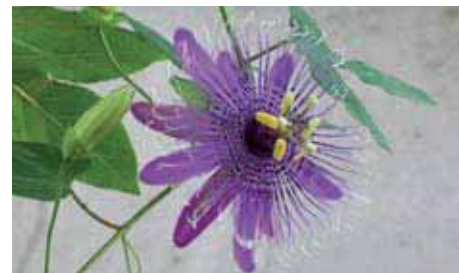
41. Passiflora 'La Lucchese'

Il fogliame è mosso, poiché le foglie trilobate hanno la lamina spesso variamente incurvata