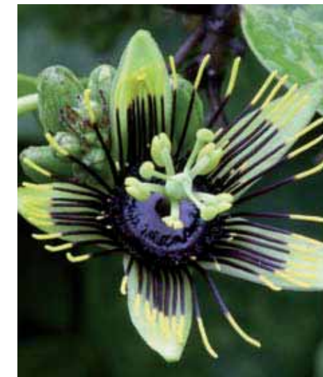
45. IN BASSO Passiflora 'Vivacemente'