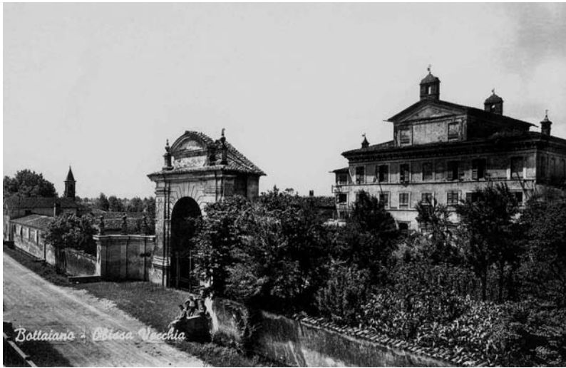
Cartolina - Bottaiano. Obizza vecchia, 1950 ca.

Nell'agosto del 1701, a causa del passaggio e della sosta dell'esercito Gallo guidato da Villeroi , la popolazione del paese fu costretta a sfollare e una parte occupò la chiesa; il parroco andò nel Palazzo Obizzi e l'oratorio di S. Michele fu usato come chiesa parrocchiale.