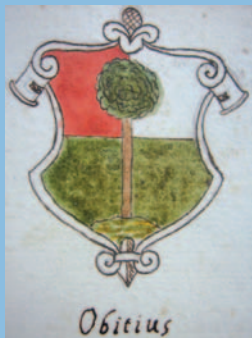
1 Stemma Obitius dal codice Benvenuti - 1666

La nobile famiglia, come si vede dalla Genealogia “ Gen. Obitys da Almeno de Frollis ”, ha quest'origine: Frollis era l'antico nome della famiglia proveniente da Almeno, paese nel bergamasco, cognome mutato in Obizzi perché Obizzo era il vero nome di battesimo di Bettino Frolli. Ipotesi sostenuta anche dallo storico scomparso Mario Perolini. Gli Obizzi furono insigniti del titolo Marchionale (Marchese) dal Duca di Parma e Piacenza Francesco Farnese, con diploma del 26