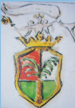
3 Stemma dei Marchesi Obizzi - 1716