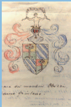
4 Stemma inquartato Marchesi Obizzi (ramo friulano) - 1780 ca