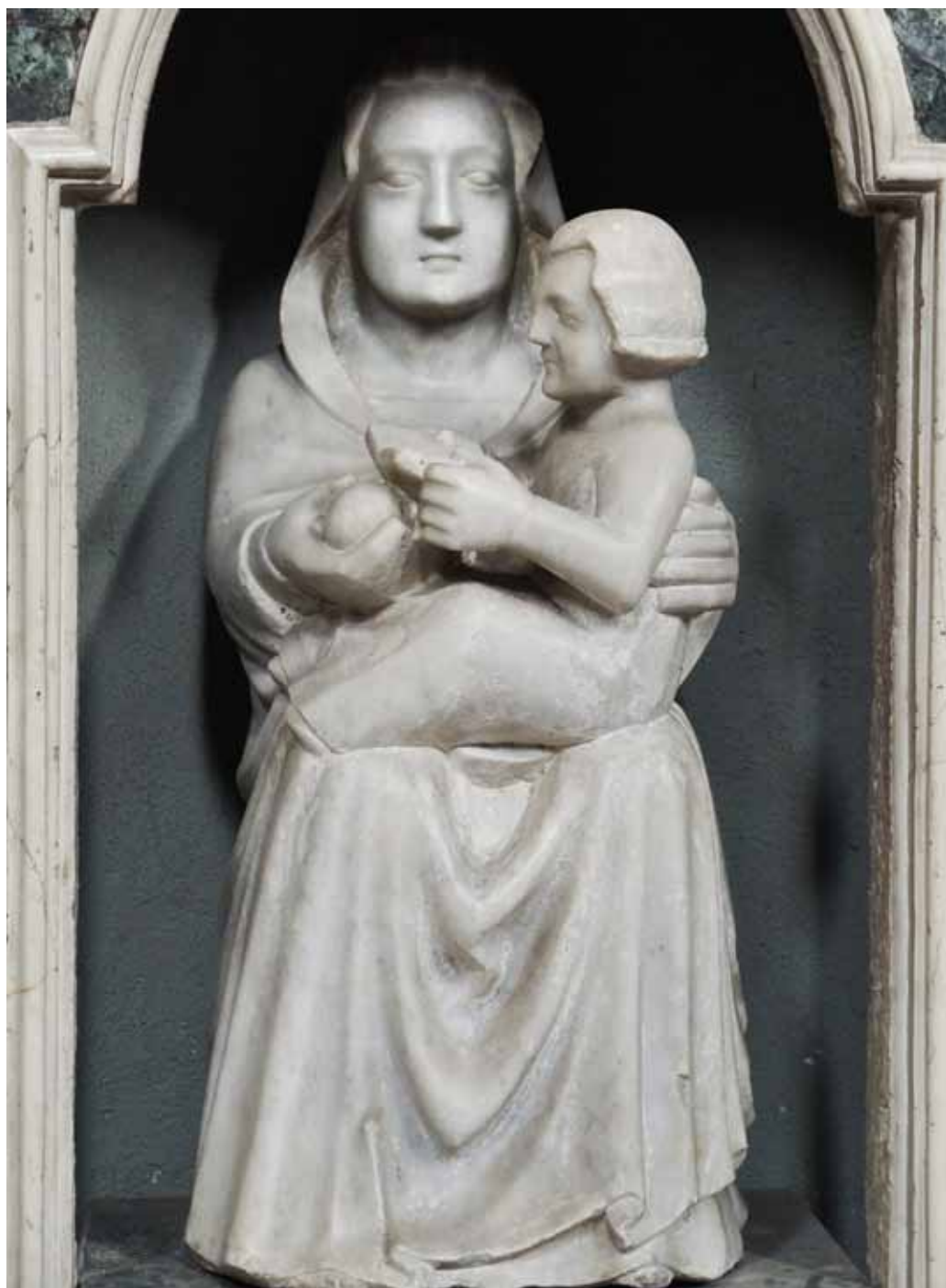
18) Giovanni da Campione e bottega, Madonna con Bambino , Rota d'Imagna, chiesa dei Santi Siro e Gottardo.