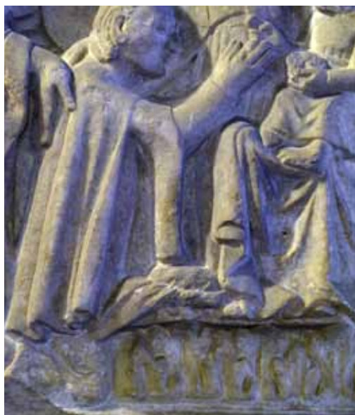
13) Sarcofago di Ardicino Benzoni , ca 1345, marmo, Verona, Museo di Castelvecchio, particolare del panneggio