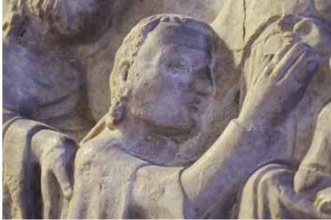
21) Sarcofago di Ardicino Benzoni , ca 1345, marmo, Verona, Museo di Castelvecchio, particolare con volto di Ardicino.