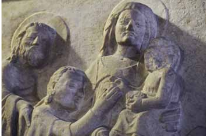
19) Sarcofago di Ardicino Benzoni , ca 1345, marmo, Verona, Museo di Castelvecchio.