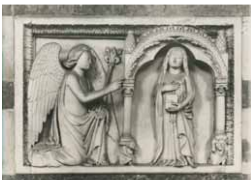
8) Giovanni da Campione e bottega, Annunciazione , battistero di Bergamo