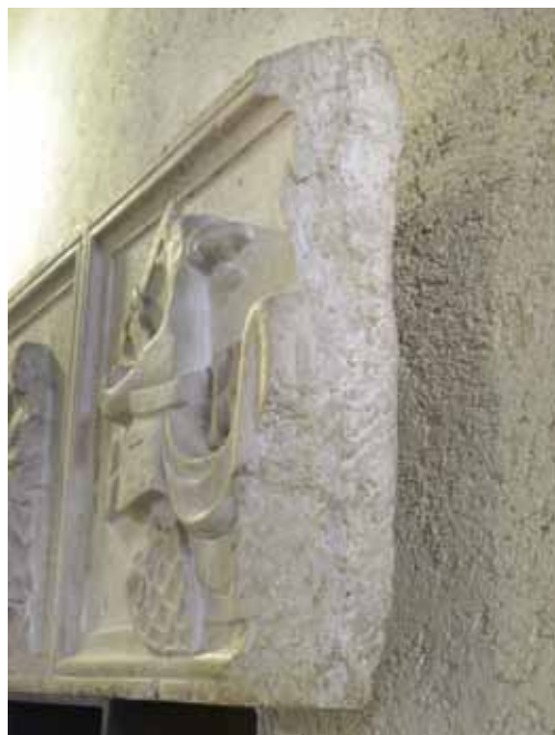
2-3) Sarcophago di Ardicino Benzoni , ca 1345, marmo, Verona, Museo di Castelvecchio, rotture laterali.