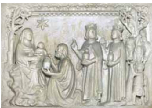
9) Giovanni da Campione e bottega, Adorazione dei magi , battistero di Bergamo, interno (da vasca battesimale)