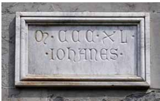
5) Epigrafe con firma di Giovanni , 1340, Bergamo, Battistero, esterno.