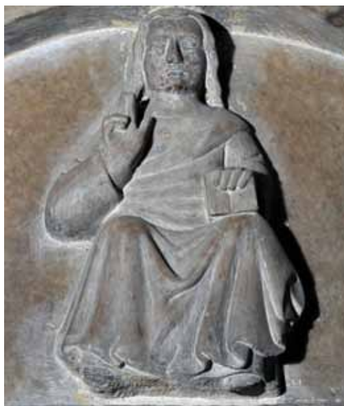
14) Ambito di Giovanni da Campione, Bergamo, Cristo benedicente , chiesa di Santa Maria Maggiore, sagrestia, lunetta del portale d'ingresso