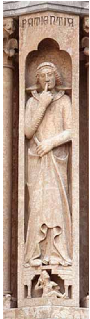
10-11-12) Giovanni da Campione e bottega, Bergamo, Battistero, esterno: Carità, Fede, Pazienza