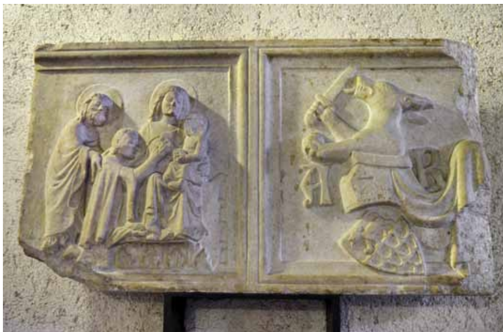
1) Sarcophago di Ardicino Benzoni , ca 1345, marmo, Verona, Museo di Castelvecchio