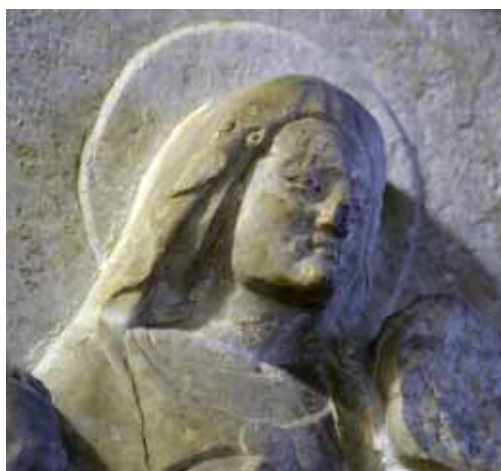
15) Sarcofago di Ardicino Benzoni , ca 1345, marmo, Verona, Museo di Castelvecchio, particolare con volto della Vergine