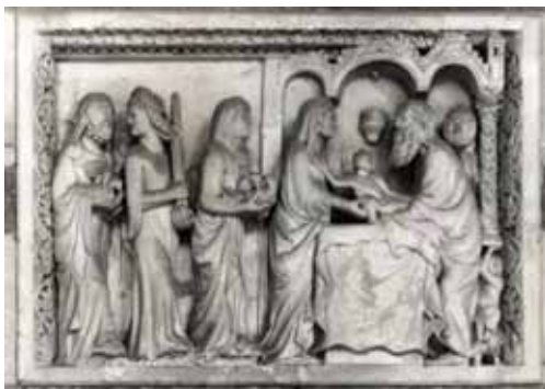
7) Giovanni da Campione e bottega, Presentazione di Gesù al tempio , battistero di Bergamo, interno (da vasca battesimale).